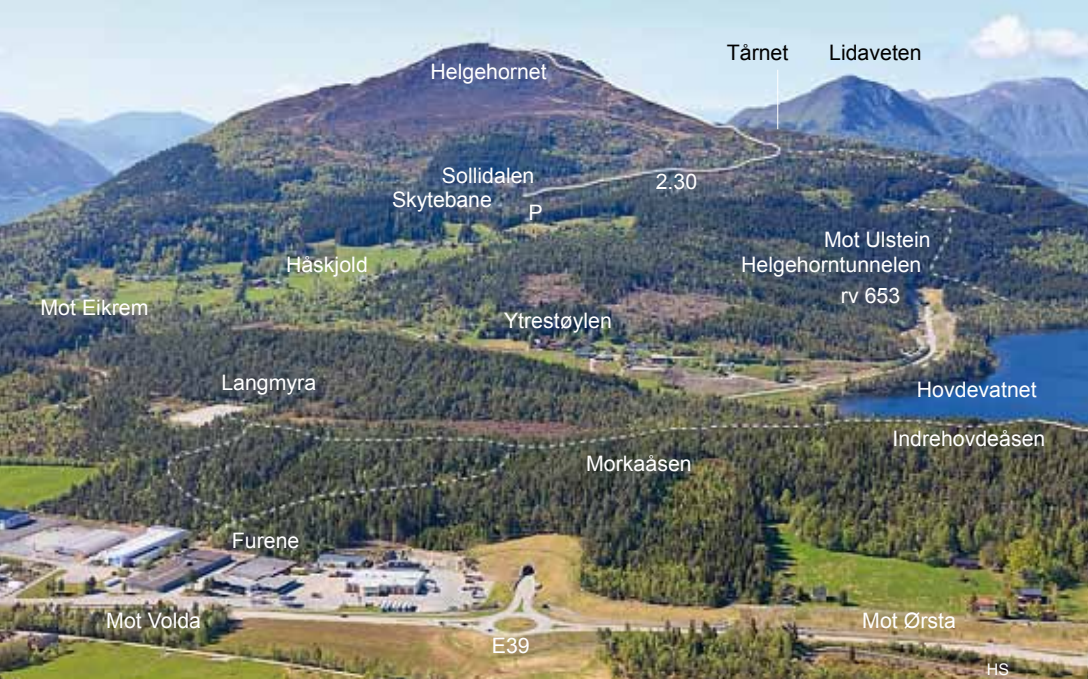
Over: Helgehornet og Morkaåsen sett frå Nivekollen. Indrehovdeåsen, sjå kapittelet om Ørsta.